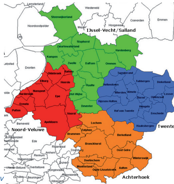
Werkgebied van de WGV

Gezien de omvang van het werkgebied is besloten in de arbeidsmarktverkenning 2009 onderscheid te maken tussen de (sub-) regio's Twente, Achterhoek, IJssel-Vecht/Salland en Noord Veluwe. Voor elke regio is een aparte rapportage opgesteld. De integrale rapportages zijn te vinden op www.wgvoost.nl . De voorliggende samenvatting beschrijft in grote lijnen de centrale thema's en conclusies en aanbevelingen, zoals deze uit de rapportages naar voren komen.